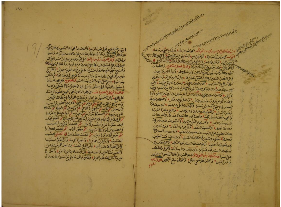
ثالثا: الصفحة الأخيرة: